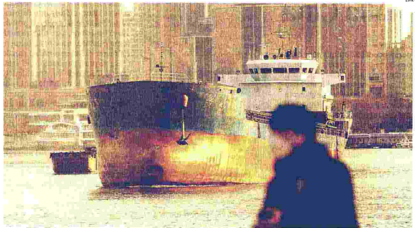
lotta delle merci. Il porto di Shanghai: per il 13° anno consecutivo è il più importante al mondo per movimentazione container

Ritaglio stampa ad uso esclusivo del destinatario, non riproducibile.