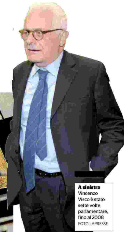
A sinistra Vincenzo Visco è stato sette volte parlamentare, fino al 2008