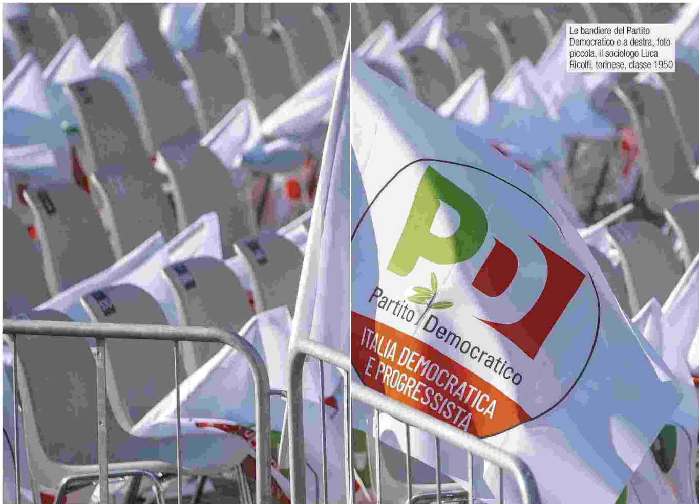
Le bandiere del Partito Democratico e a destra, foto piccola, il sociologo Luca Ricolfi, torinese, classe 1950