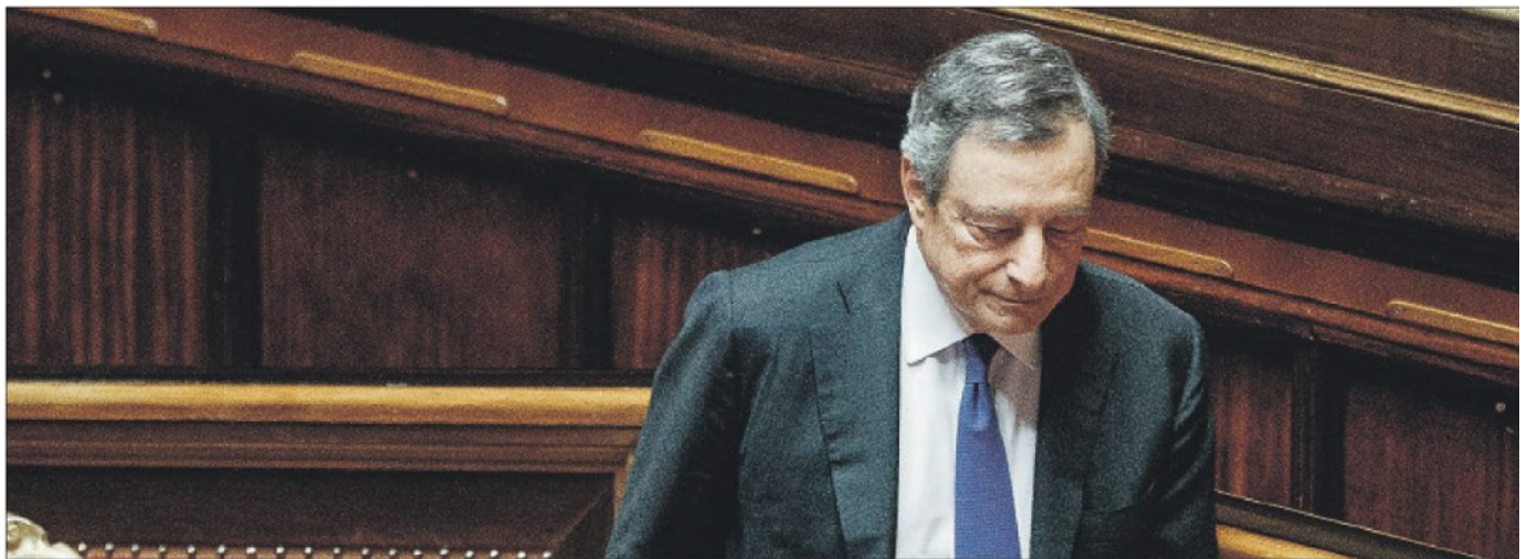
Mario Draghi durante la discussione di ieri al Senato

Serve un sostegno convinto non uno fatto di proteste non autorizzate o violente contro la maggioranza di governo