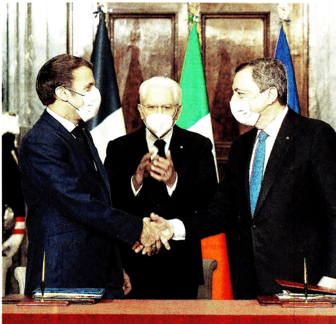
Il trattato del Quirinale. Macron e Draghi si stringono la mano dopo la firma del trattato, sotto gli occhi di Mattarella

L'Unione è cresciuta da un nucleo di sei Paesi fondatori dell'allora Comunità economica europea fino al numero di 27 di oggi.