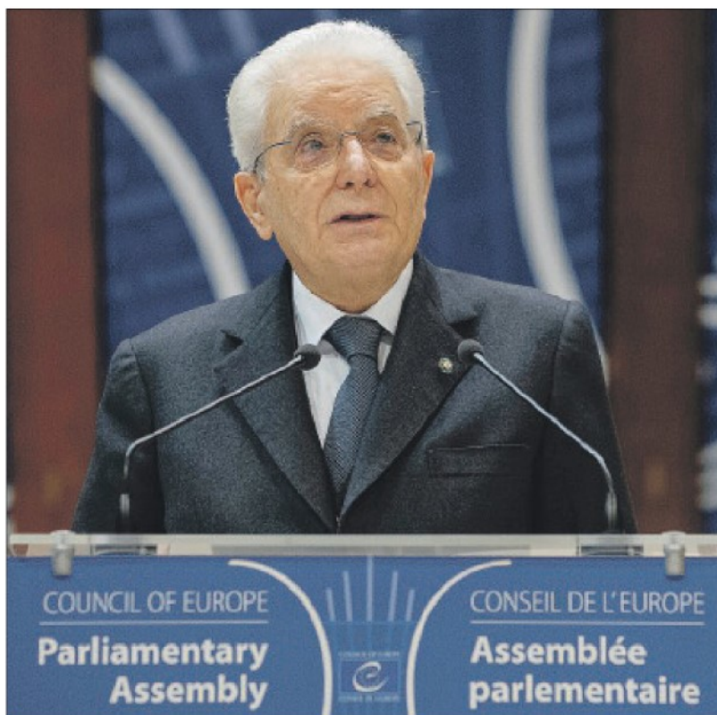
Sergio Mattarella durante il suo intervento a Strasburgo

Ma se il compito non è esaurito, tocca proprio a noi corrispondere alle sfide di oggi, sviluppandone e attuandone i principi. Auguri di buon lavoro – quindi – a tutti noi e grazie dell'attenzione.