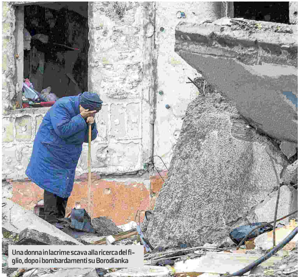
Una donna in lacrime scava alla ricerca del figlio, dopo i bombardamenti su Borodianka

Lucio Caracciolo (Roma, 1954) è un giornalista e scrittore, fondatore della rivista di geopolitica Limes . Docente universitario, insegna Geografia politica ed economica alla Vita salute-San Raffaele, Studi strategici alla Luiss. Ha scritto dodici saggi, l'ultimo dei quali è L'eredità geopolitica della Grande guerra in Senza la guerra (edito da Il Mulino nel 2016). —