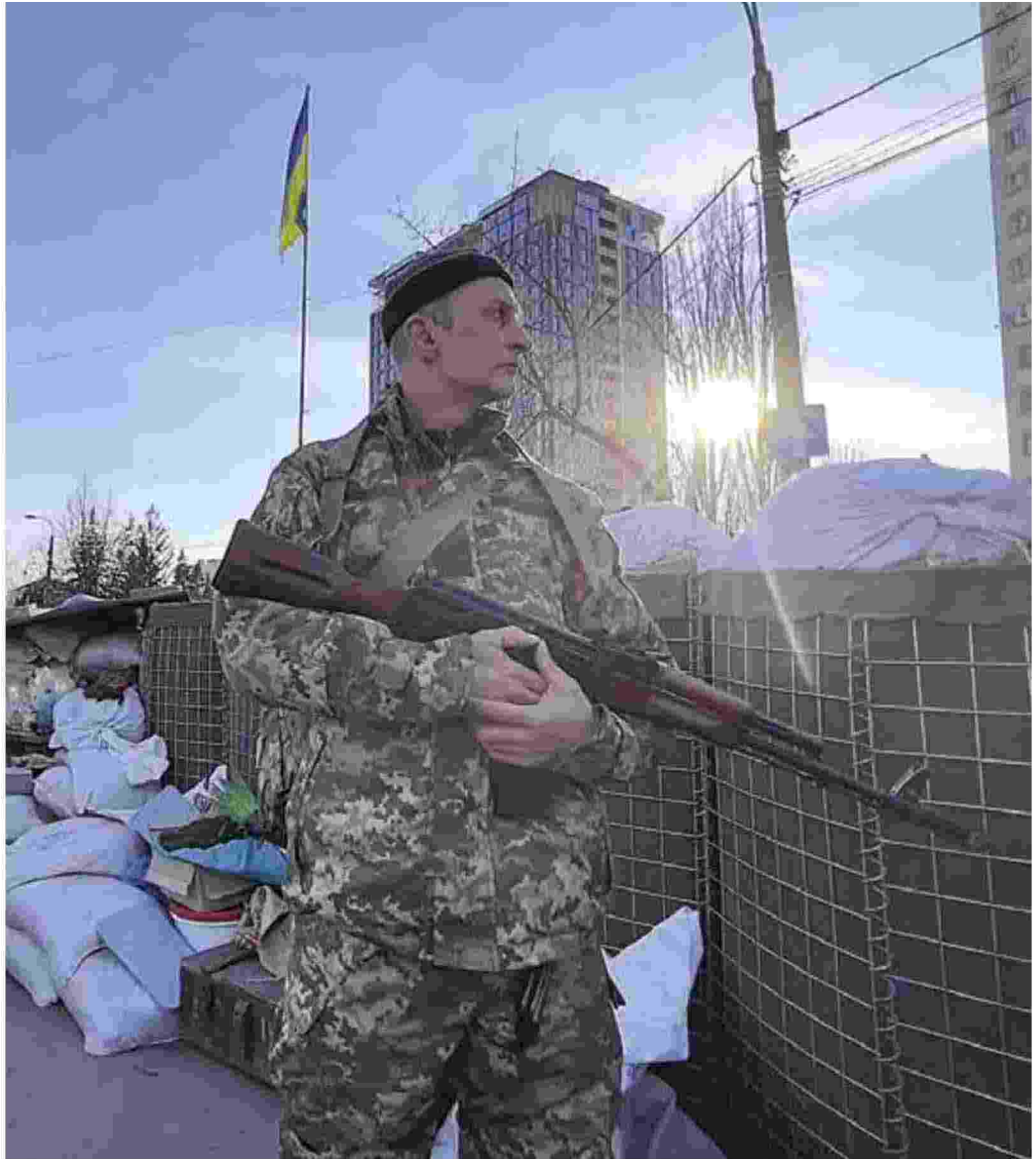
Soldati ucraini a Kiev A destra Graziano Delrio

Sono un pacifista, con tormento ho votato a favore dell'invio di armi all'Ucraina per aiutare la loro resistenza. Ma il nostro compito è trovare subito una soluzione diplomatica