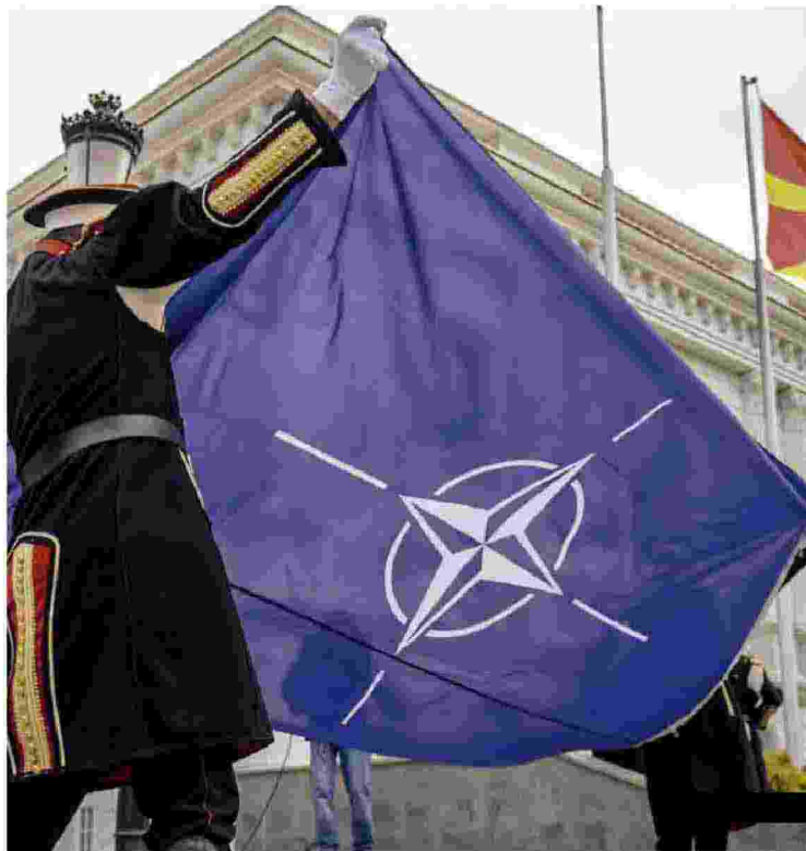
La bandiera Il simbolo della Nato, l'Alleanza fondata nel '49

NATO a Bisceglie, in Puglia, nel 1948, Giovanni Ricchiuti è arcivescovo e presidente del movimento cattolico Pax Christi in Italia. Nel 2013 è stato nominato vescovo di Altamura-Gravina-Acquaviva delle Fonti da Papa Francesco. È da anni impegnato nella sensibilizzazione sul disarmo nucleare e nel sostegno della pace. Si è detto contrario all'invio di armi in Ucraina