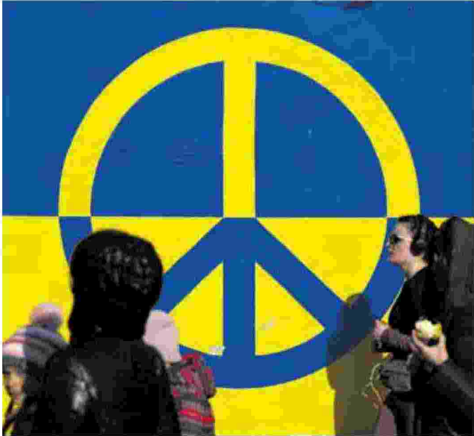
Il simbolo della pace, Varsavia

dente Trump, dal trattato del 1987 sul progressivo disarmo nucleare, e indurre tutti gli Stati dotati di armamenti atomici a riprendere questo graduale processo, fino al disarmo nucleare dell'intero pianeta.