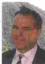
Chi è/1 Niall Ferguson, 57 anni, è uno storico (docente ad Harvard), saggista e giornalista