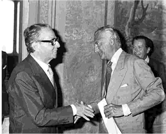
Ugo la Malfa con Gianni Agnelli, anni '60