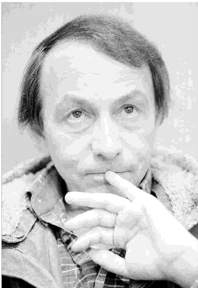
"Annientare", il nuovo romanzo di Michel Houellebecq ora in libreria, è pubblicato in Italia da La nave di Teseo

Lo stadio finale dell'autodeterminazione è l'autodistruzione.