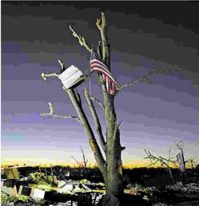
Una bandiera americana sventola sul post tornado, Mayfield, Ky

porta possono emergere e affermarsi in tutta la loro valenza e potenza. Non lo fanno «loro»? Dobbiamo farlo noi.