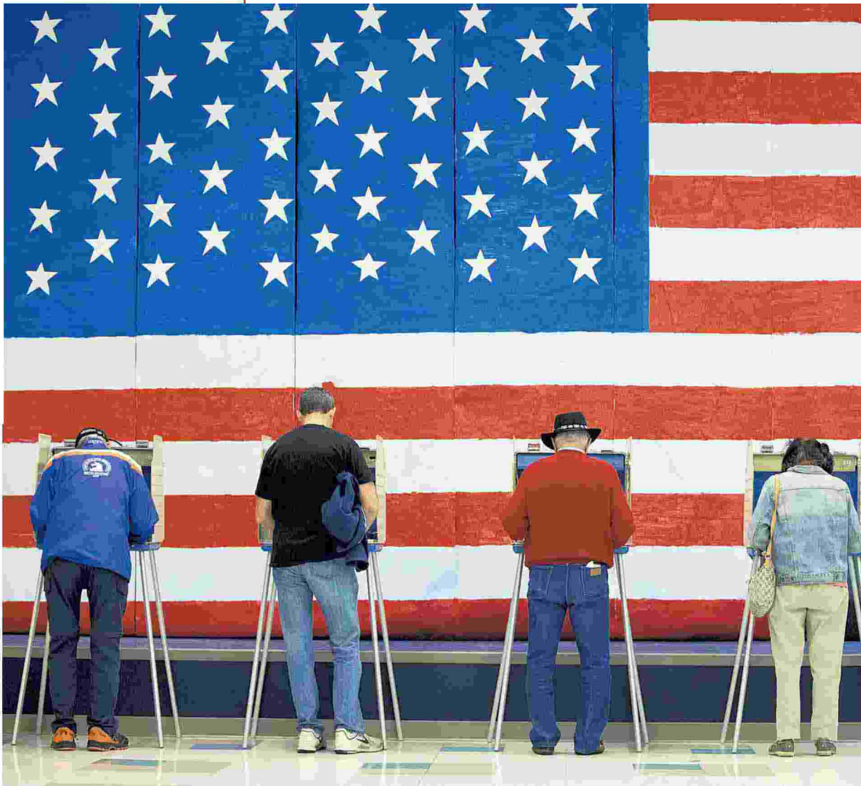
Elettori al voto in un seggio nello Stato della Virginia negli Usa