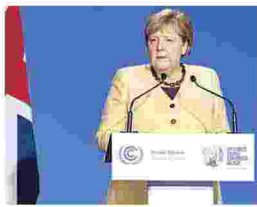
ANGELA MERKEL CANCELLIERA TEDESCA

Abbiamo iniziato a disinnescare la bomba. Siamo a un minuto dall'Apocalisse