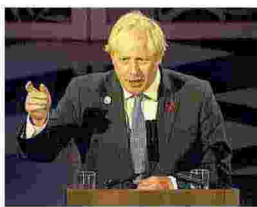
BORIS JOHNSON PRIMO MINISTRO DEL REGNO UNITO

Basta trattare la natura come se fosse un gabinetto