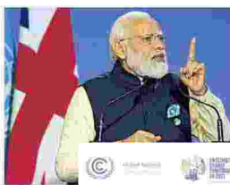
NARENDRA MODI PRIMO MINISTRO DELL'INDIA

Sappiamo che i Paesi sviluppati hanno una speciale responsabilità