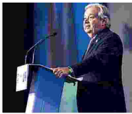
ANTÓNIO GUTERRES SEGRETARIO GENERALE DELLE NAZIONI UNITE