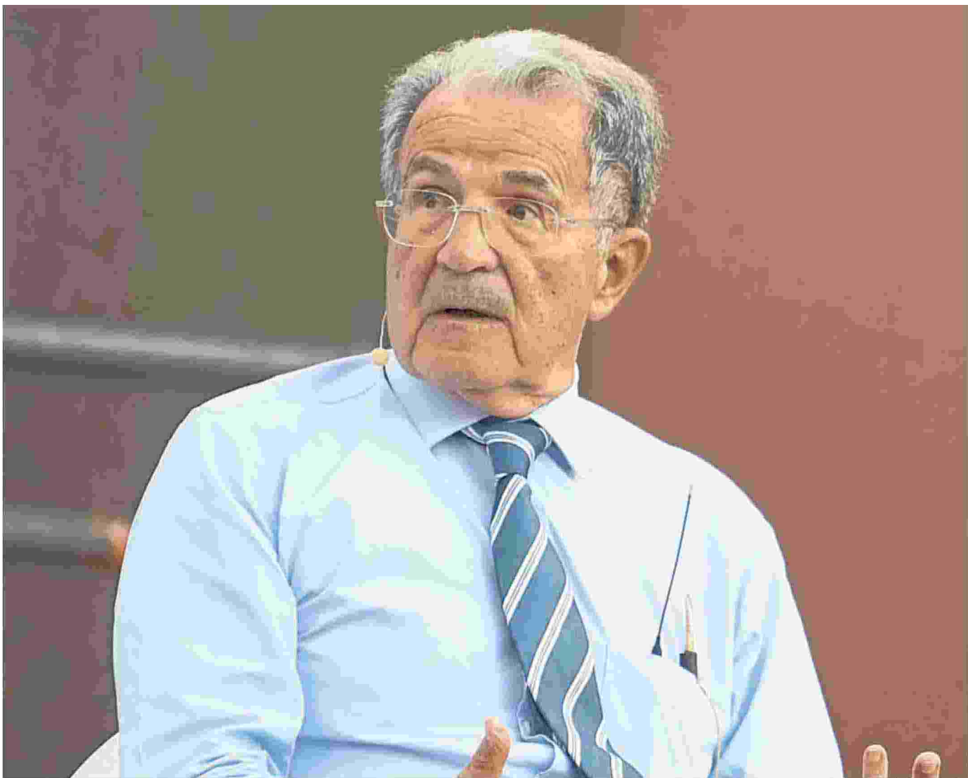
Romano Prodi, 82 anni, è stato presidente del Consiglio dal 1996 al 1998 e dal 2006 al 2008