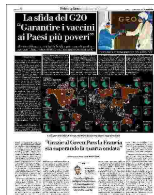
▲ Roberto Speranza con la collega spagnola Carolina Darias al G20 di Roma