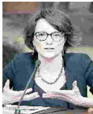
Elena Bonetti, ministra delle Pari opportunità

SE IL FUTURO SARÀ DISEGNATO DAGLI ALGORITMI IL CONTRIBUTO FEMMINILE NON PUÒ ESSERE ESCLUSO