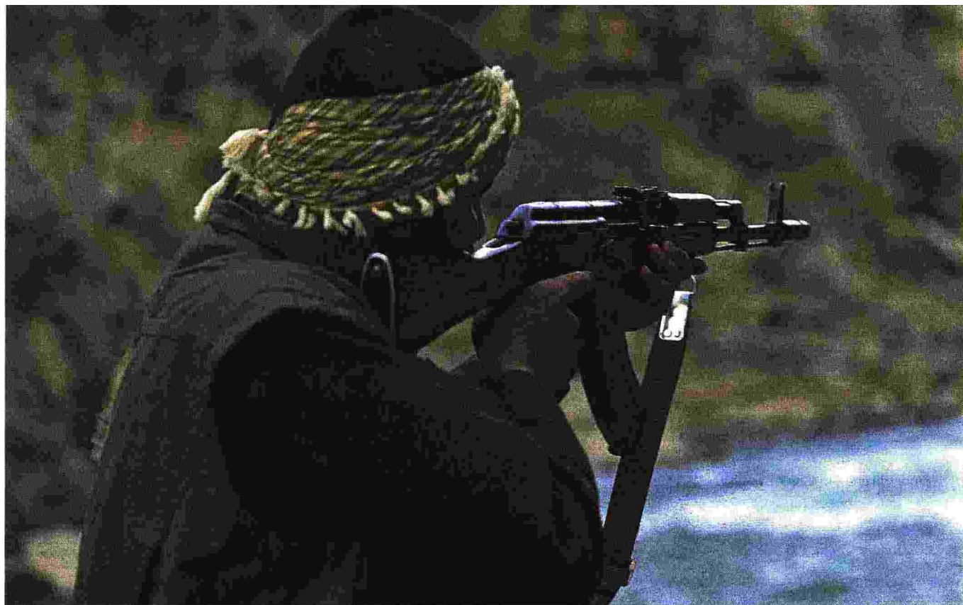
Un militante della resistenza afghana anti-Talebani in azione di pattugliamento su una strada a Rah-e Tanz, nella provincia del Panishir