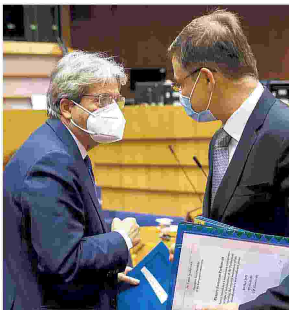
Il commissario Ue Gentiloni e il vicepresidente Dombrovskis

Non è escluso che il decreto reclutamento, come lo chiama Renato Brunetta, finisca diviso in due parti: bisogna superare lo stallo sulle assunzioni previste dal Pnrr. Intanto Bruxelles interviene sul blocco dei licenziamenti con una bocciatura: "Non favorisce il lavoro". - PP.4-7