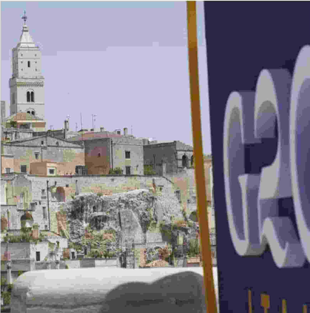
Matera, g20