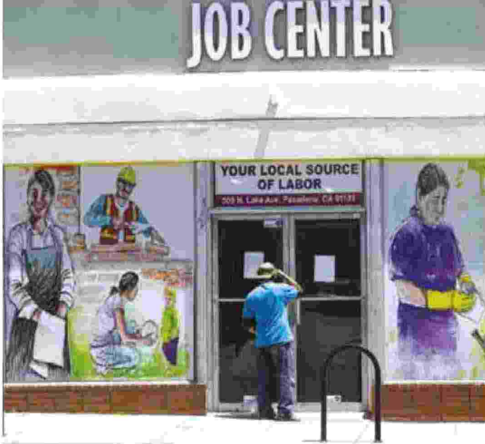
Una agenzia americana del lavoro

mento, trasformazione. L'ambizione è di incidere profondamente sullo status quo e modificare radicalmente il modello di sviluppo.