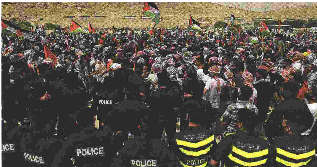
Contro Israele Una manifestazione di solidarietà ai palestinesi nella città giordana di Karameh