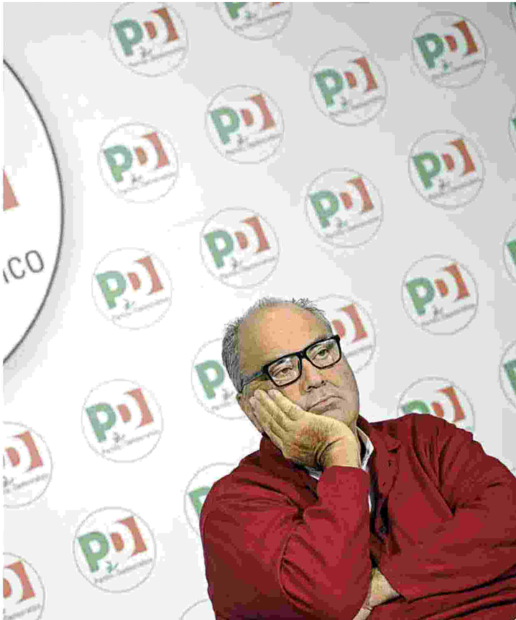
Goffredo Bettini