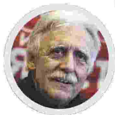
Docente e scrittore Insegna all'Università degli Studi del Piemonte Orientale

Nando Pagnoncelli sul Corriere definisce il calo di gradimento di Mario Draghi e del suo governo "un rimbalzo tecnico". Disicuro i primi numeri del premier erano "dopati". Gonfiati da una prevalente stampa, che aveva gridato al miracolo, laddove di miracoloso non ci si può aspettare niente dalla politica contemporanea. Era stata creata un'aspettativa esagerata, come se con un tocco di bacchetta