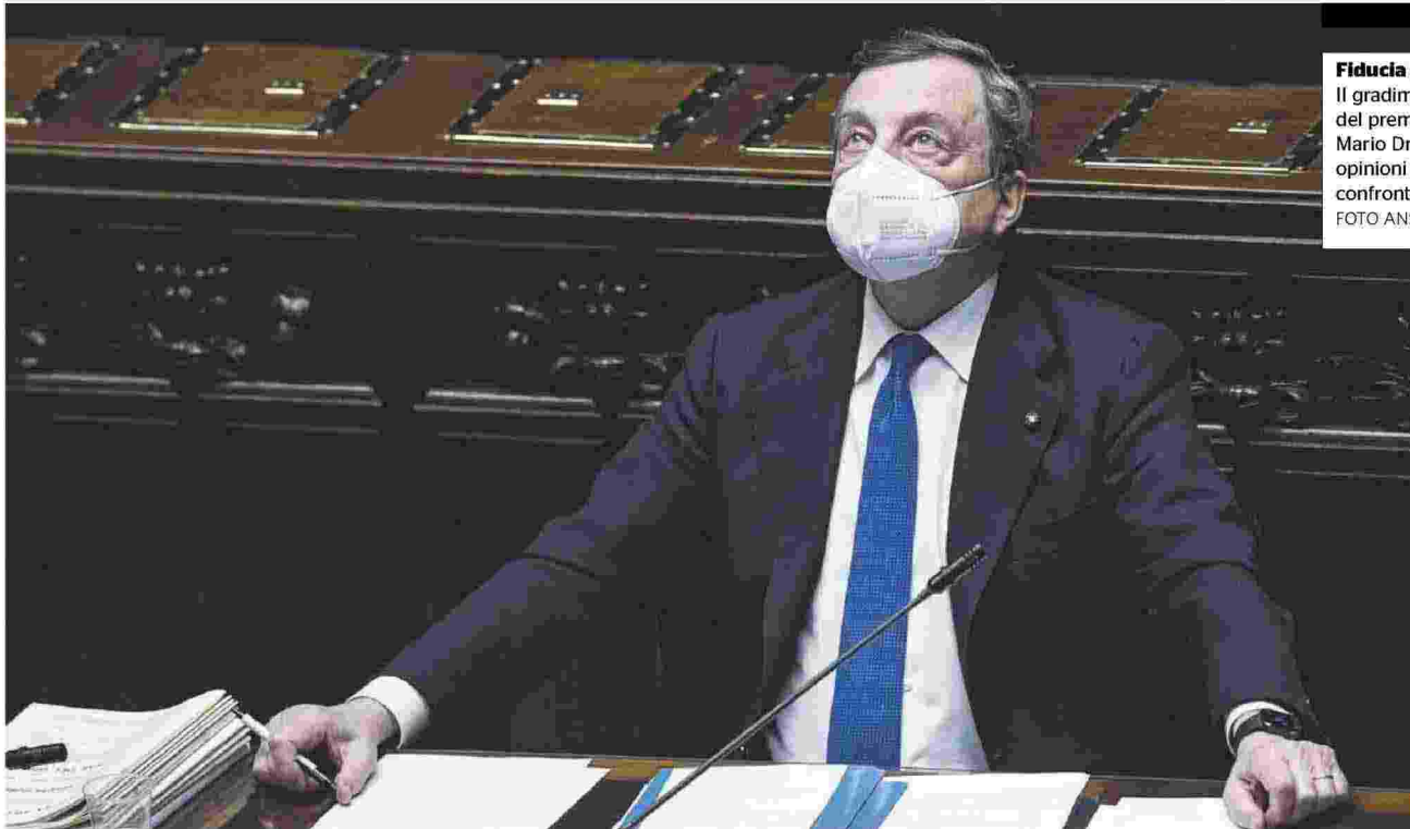
Fiducia giù Il gradimento del premier Mario Draghi: opinioni a confronto

ficoltà nella campagna vaccinale, la mancanza di "rivoluzioni" e una sostanziale continuità nella gestione della pandemia rispetto a chi lo precedeva. Abbiamo chiesto il parere di sei autorevoli osservatori e studiosi della politica italiana.