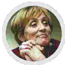
Filosofa Ha insegnato nelle università di Pisa, Milano e Ginevra

Da cittadina semplice, credo che Draghi stia pagando la forte delusione dell'opinione pubblica su un tema specifico, quello del condono. Il premier aveva fatto un discorso alle Camere che aveva un punto di caduta fondamentale: la crisi della pandemia sarebbe stata affrontata in contemporanea alla crisi delle istituzioni, oggetto di un rinnovamento profondo.