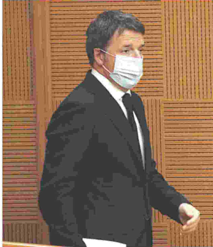
Matteo Renzi

Il Machiavelli di Rignano ha ben compreso che solo se è al servizio della logica ineliminabile del capitale, può avere spazi necessari per il suo riconoscimento e per i suoi affari