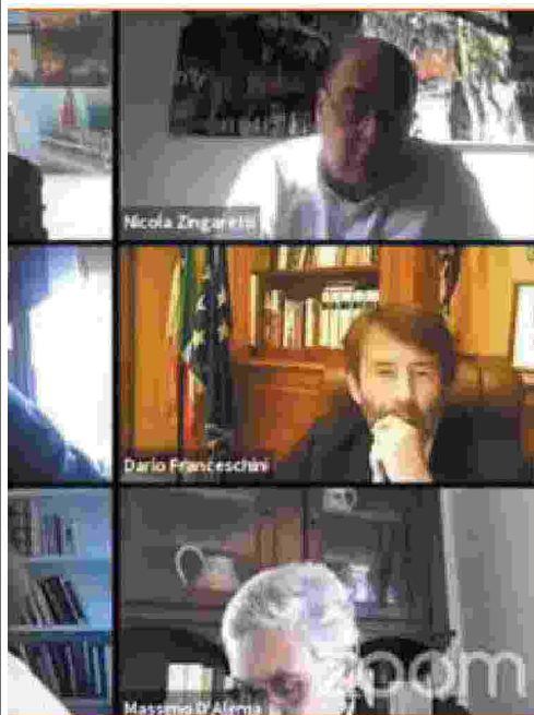
In alto nella pagina affianco Mario Tronti

«Ma davvero si pensa di affidare la ricostruzione del dopoguerra pandemico a questo signor Nessuno che briga tutto il giorno per diventare Qualcuno? Si licenzi questo intruso. Per tutto quello che sta per venire c'è bisogno a Palazzo Chigi di un cavallo di razza»