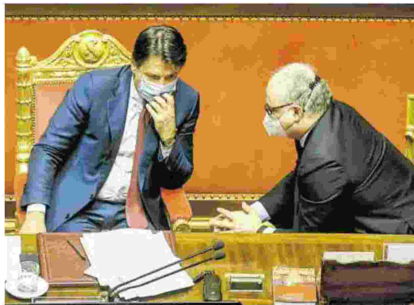
▲ Il premier Conte e il ministro dell'Economia Gualtieri

Negli ultimi sette anni sono stati utilizzati solo 16 miliardi di fondi strutturali sui 40 assegnati