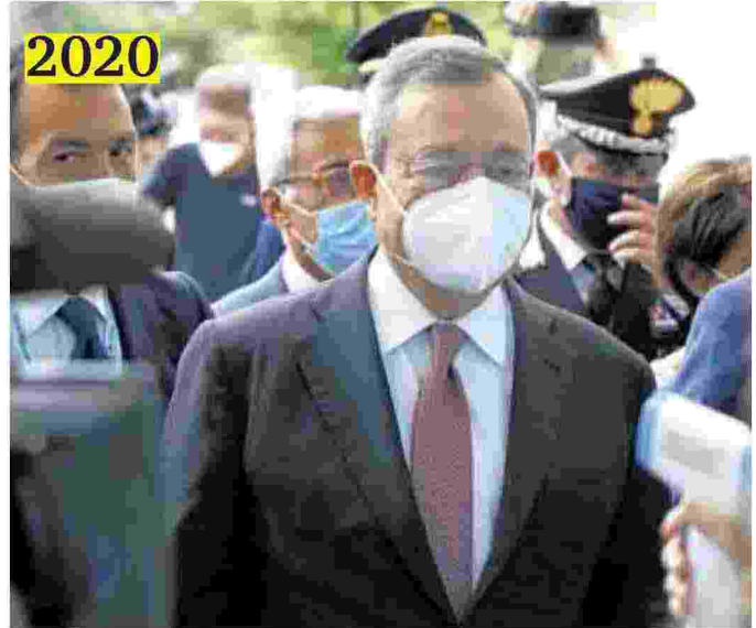
Al Meeting di Rimini Draghi pronuncia un discorso sul post pandemia: «Ai giovani bisogna dare di più, il loro futuro è a rischio: i sussidi finiranno e ci sarà mancanza di una qualificazione professionale».