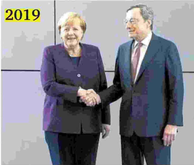
La stretta di mano con la cancelliera Angela Merkel alla cerimonia di fine mandato di «Supermario» a Francoforte. A succedergli alla guida della Bce sarà la francese Christine Lagarde.