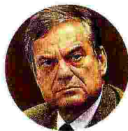
LORENZO BINI SMAGHI Presidente di Société Générale

“ Non conta tanto la quantità di investimenti quanto il dinamismo sottostante del sistema economico nel quale tali investimenti vengono innestati.