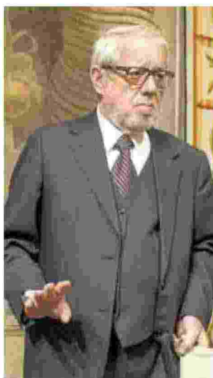
Giovanni Maria Flick

«Esatto. È il vero nodo. Per come la vedo io, questo taglio è preparatorio al passaggio dalla democrazia parla-