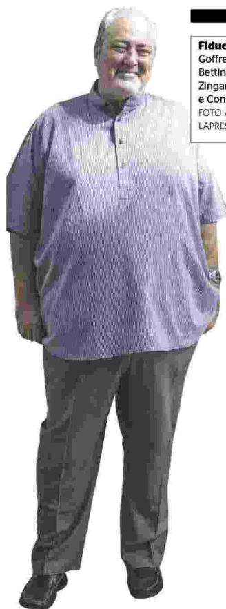
Fiducia Goffredo Bettini. Sopra, Zingaretti e Conte