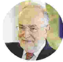
UGO DE SIERVO