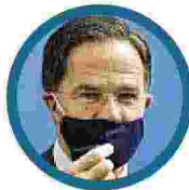
Frugal Four Il premier olandese Mark Rutte, leader dei «Paesi Frugali»