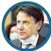
Premier Giuseppe Conte ha incassato un grande successo in Europa

Non sono una lobby. Non offrono in cambio dei voti, né relazioni di potere, ma solo l'impegno a cambiare l'Italia. Altri, loro coetanei, se ne sono semplicemente andati. Cercando altrove le miniere del loro futuro.