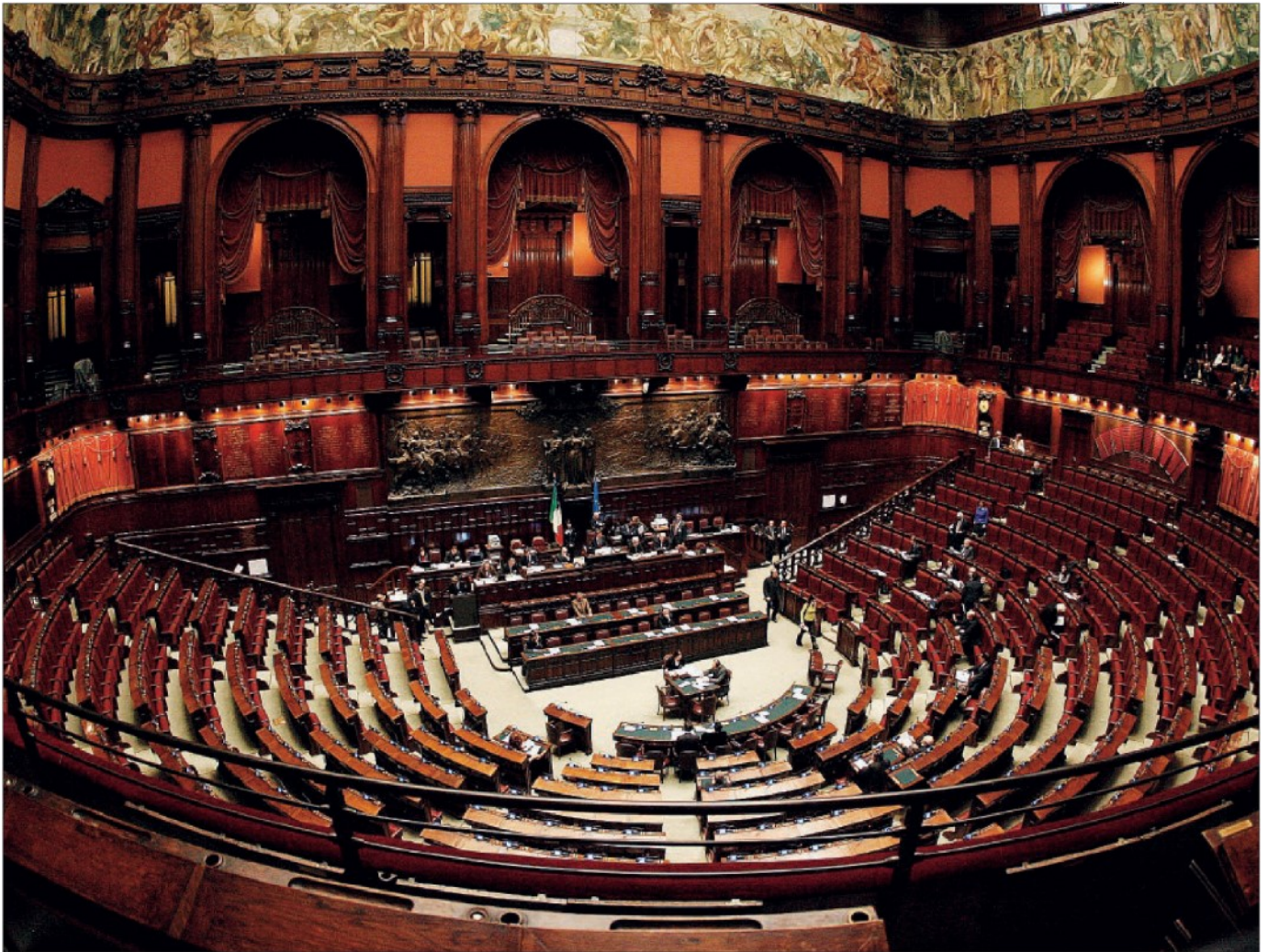
Oggi la Camera "costa" 960 milioni all'anno e il Senato 545: vi è un rapporto preciso fra componenti e spesa