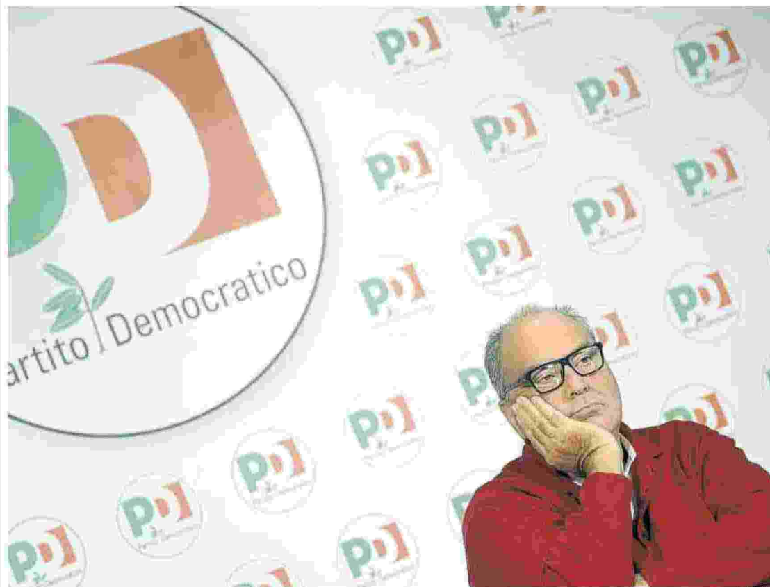
Goffredo Bettini, 67 anni, ha un passato da deputato, senatore ed europarlamentare