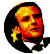
IL TANDEM PARIGI-BERLINO Merkel e Macron (nella foto) hanno fatto fronte comune nel negoziato