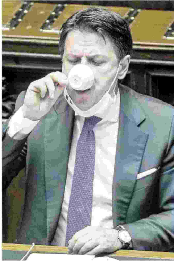
Giuseppe Conte Sotto, Ursula von der Leyen