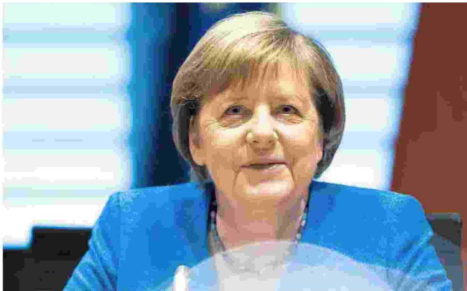
Angela Merkel, 65 anni, dal 2005 è Cancelliera federale della Germania