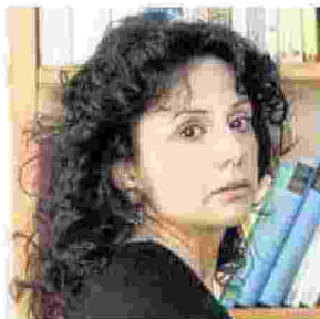
Donatella Di Cesare Filosofa, saggista, docente