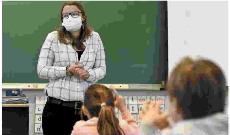
Per uno studente su due la didattica a distanza è un flop