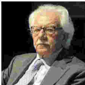
Alberto Asor Rosa Scrittore, docente, critico