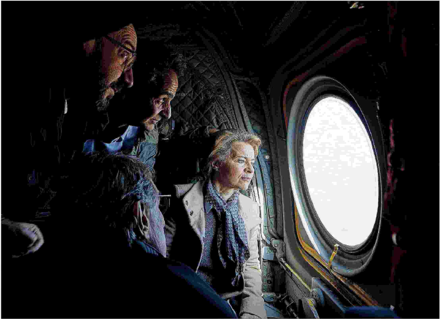
Ursula von der Leyen, Charles Michel e David Sassoli con il premier greco Kyriakos Mitsotakis sorvolano il confine tra la Turchia e la Grecia