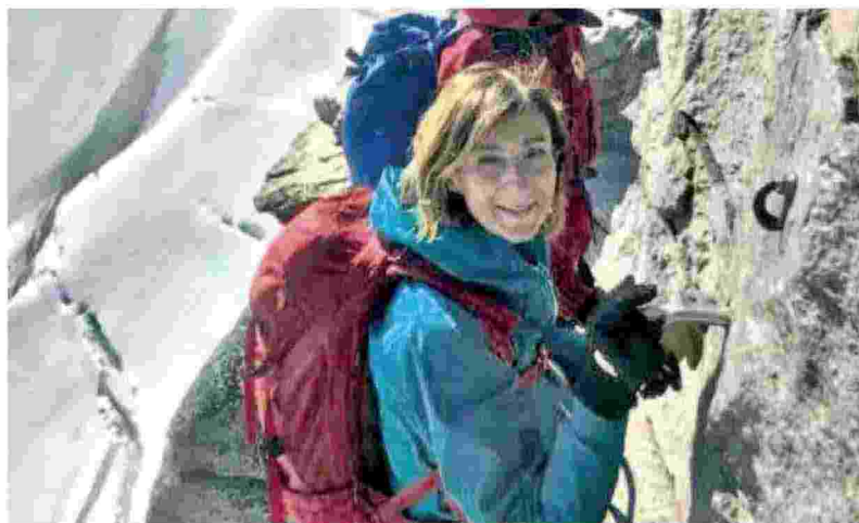
▲ La montagna Cartabia ama la montagna: tra le sue altre passioni, la musica