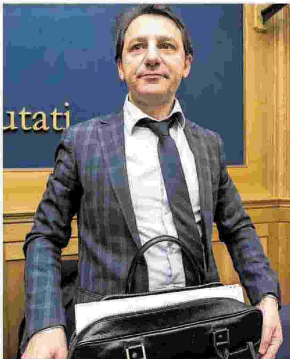
Pasquale Tridico, presidente dell'Inps