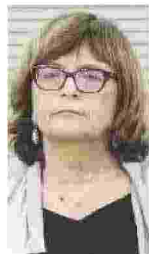
Politologa, insegna negli Usa

L uigi Di Maio è sempre stato un leader nominato più che eletto, nel senso che a volerlo sono stati Beppe Grillo e Davide Casaleggio e poi la Rete lo ha confermato. Ma l'addio di un leader nominato è molto diverso dall'addio di un leader carismatico, non credo che per il Movimento la sua uscita sarà così drammatica. Certo è che pone i 5Stelle davanti a una scelta: o si strutturano come un partito o scelgono la liquefazione a fine legislatura.