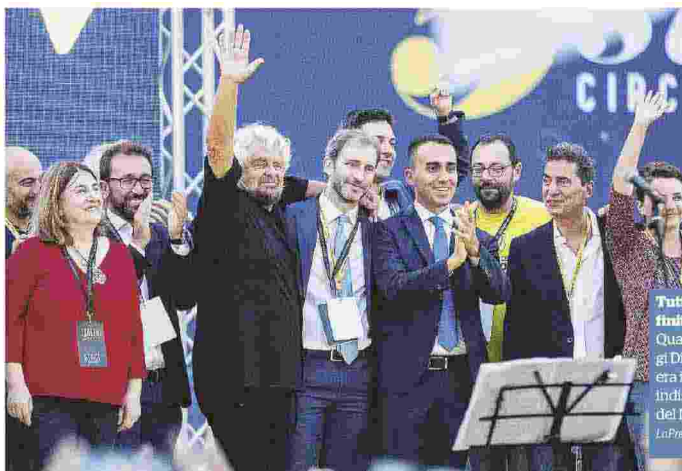
Tutto finito Quando Luigi Di Maio era il capo indiscusso del M5S

Dimettersi adesso è da una parte una scelta di de-responsabilizzazione in vista delle Regionali, ma forse è anche un modo per dire: "Adesso vediamo cosa sanno fare gli altri". Per il futuro però non escluderei che Di Maio possa tornare sul "luogo del delitto", vuoi perché l'effetto nostalgia a volte funziona, vuoi perché bisognerà vedere come si comporteranno i suoi competitor all'interno del Movimento. Di certo Di Maio paga un dimezzamento dei consensi dei 5Stelle che è imputabile a lui in parte, ma non del tutto. L'errore del Movimento è stato quello di non darsi immediatamente una struttura da partito di governo, perché era necessario fin da subito raccontare nei territori cosa veniva fatto, perché veniva fatto, eccetera. E poi sul suo consenso personale ha pesato anche il cumulo di responsabilità, tra compiti di governo e incarichi nel Movimento. Il tema vero per il M5S adesso sarà recuperare la fiducia della gente: di certo il messaggio non arrivava più, era necessario organizzarsi in maniera diversa.