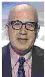
Ha fondato "Noto sondaggi"

L e dimissioni da capo politico di Luigi Di Maio sono anomale perché arrivano in ritardo, nel senso che probabilmente in altri partiti il leader avrebbe lasciato dopo la sconfitta alle Europee o dopo qualche crollo alle Regionali. Il suo consenso personale non è mai stato altissimo, neanche quando il Movimento era sopra il 30 per cento. Ora però si apre un buco nero per i simpatizzanti dei 5 Stelle, non tanto perché le dimissioni di Di Maio rappresentino un problema enorme, ma perché l'incertezza per quel che accadrà adesso può spaventare gli elettori. Non c'è un leader alternativo: Alessandro Di Battista, che pure sarebbe conosciuto, sarebbe ancor più inconciliabile col nuovo corso di governo del Movimento. E non c'è una struttura pronta a subentrare. Quando nel Pd si dimise Matteo Renzi ci fu una lunga fase intermedia prima delle primarie in cui Maurizio Martina fece da segretario reggente. Era una situazione provvisoria, ma con un percorso chiaro verso il congresso e le primarie che qui i simpatizzanti dei 5 Stelle non vedono.