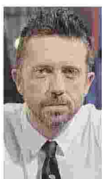
Giornalista e conduttore tv

N on so perché, ma ultimamente ogni volta che penso ai 5Stelle (e non mi capita spesso) mi viene in mente l'immagine del dead man walking : il morto che cammina. Neanche se lo meritano, perché al loro interno ci sono figure meritorie e le battaglie sono spesso condivisibili, ma dall'unione scellerata (per quanto lecita) con Salvini in poi è stata una slavina continua. E pure col Pd se la stanno giocando malino (anche per colpa del Pd). Di Maio ha sbagliato tanto, dal giugno 2018 in poi, ma è un problema: non il problema. Fa bene a uscire di scena (non so per quanto) come leader, ma chi mettono al suo posto? Mario Michele Giarrusso? La Castelli? Uno dei tanti Scilipoti mosci che giocano ai martiri? Mi vengono in mente tre nomi buoni: Appendino, Di Battista, Morra. Il secondo ha più forza, sì, ma ha senso solo all'opposizione. In ogni caso, che scelgano Hulk o Vercingetorige, o ritrovano in fretta una visione (un sogno, uno slancio, un'utopia) o hanno meno futuro dei tre capelli in croce rimasti a Marattin.