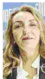
Sondaggista, dirige "Euromedia"

Dimettersi adesso è da una parte una scelta di de-responsabilizzazione in vista delle Regionali, ma forse è anche un modo per dire: "Adesso vediamo cosa sanno fare gli altri". Per il futuro però non escluderei che Di Maio possa tornare sul "luogo del delitto", vuoi perché l'effetto nostalgia a volte funziona, vuoi perché bisognerà vedere come si comporteranno i suoi competitor all'interno del Movimento. Di certo Di Maio paga un dimezzamento dei consensi dei 5Stelle che è imputabile a lui in parte, ma non del tutto. L'errore del Movimento è stato quello di non darsi immediatamente una struttura da partito di governo, perché era necessario fin da subito raccontare nei territori cosa veniva fatto, perché veniva fatto, eccetera. E poi sul suo consenso personale ha pesato anche il cumulo di responsabilità, tra compiti di governo e incarichi nel Movimento. Il tema vero per il M5S adesso sarà recuperare la fiducia della gente: di certo il messaggio non arrivava più, era necessario organizzarsi in maniera diversa.