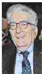
Insegna Scienze Politiche

L a scelta di Luigi Di Maio deve essere per il Movimento un'occasione per ripartire, per riprendere quello stile originario che il leader ogni tanto aveva dimenticato, tra i suoi alti e bassi. Deve essere l'inizio di una nuova fase in cui si dice che l'esperienza di questi anni ha insegnato molto e che un conto sono i programmi della campagna elettorale e un'altra la realtà di governo. Tutto questo può essere fatto nell'ambito del riformismo di centrosinistra, per quanto al loro interno i 5 Stelle possano mantenere aspetti diversi.