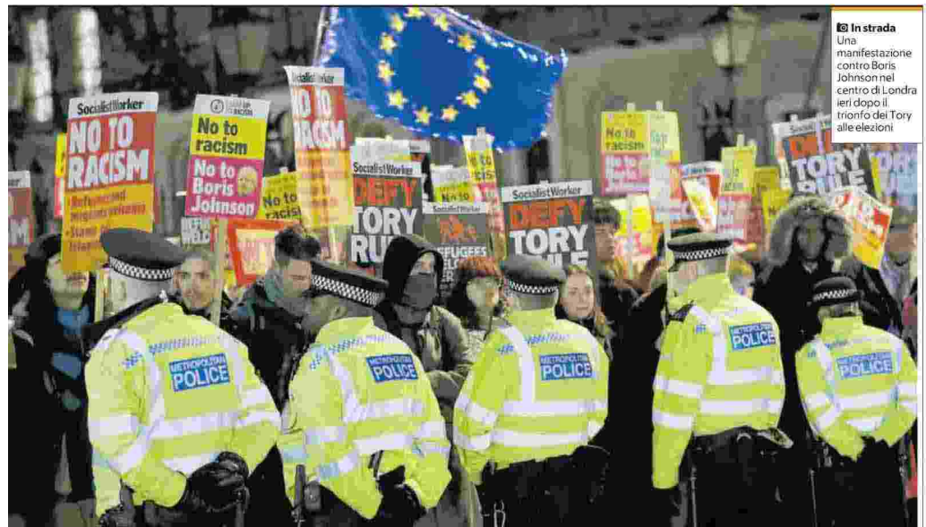
In strada Una manifestazione contro Boris Johnson nel centro di Londra ieri dopo il trionfo del Tory alle elezioni