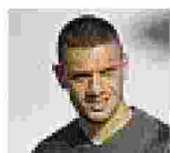
Il calciatore Merih Demiral, è difensore della Juve e gioca nella nazionale turca

M erih Demiral nella bufera per un tweet nel quale manifesta il suo appoggio all'azione militare della Turchia al confine con la Siria contro i curdi. Il difensore della Juventus sui social ha rilanciato lo slogan nazionalista coniato da Atatürk «Pace in patria, pace nel mondo», insieme a una foto di un soldato che parla con una bambina mentre alle sue spalle passa un carro armato con la bandiera turca (sopra nella foto i raid).