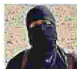
Il boia Mohammed Emwazi, alias Jihadi John è stato ucciso in un raid nel 2015

M erih Demiral nella bufera per un tweet nel quale manifesta il suo appoggio all'azione militare della Turchia al confine con la Siria contro i curdi. Il difensore della Juventus sui social ha rilanciato lo slogan nazionalista coniato da Atatürk «Pace in patria, pace nel mondo», insieme a una foto di un soldato che parla con una bambina mentre alle sue spalle passa un carro armato con la bandiera turca (sopra nella foto i raid).