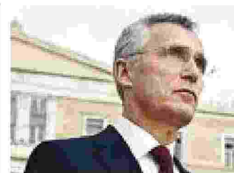
Vertice Jens Stoltenberg è segretario generale della Nato dal 2014