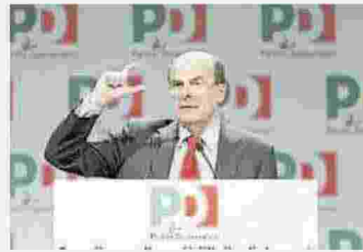
Bersani durante gli anni alla guida del Partito democratico

Ministro Bersani è stato ministro nei governi dell'Ulivo e dell'Unione. In precedenza è stato anche presidente dell'Emilia Romagna