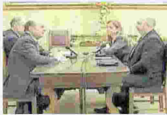
In streaming durante le consultazioni del 2013 con i 5S

Dopo le politiche del 2013 viene incaricato da Giorgio Napolitano di formare un nuovo governo. Ma le consultazioni hanno esito negativo