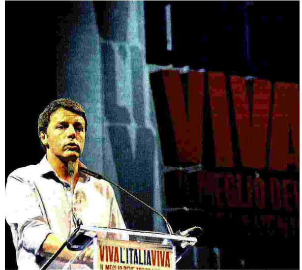
Ex premier Matteo Renzi , 44 anni, leader della nuova formazione politica «Italia Viva»