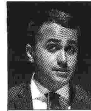
Luigi Di Maio ministro dello Sviluppo