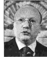
Vincenzo Boccia , pres. Confindustria