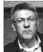
Maurizio Landini segr. gen. Cgil